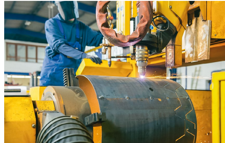
Plasma- und Autogenschneidanlage MICROSTEP: Rohrschnitte bis DN 600 und Blechdicken bis 60 mm