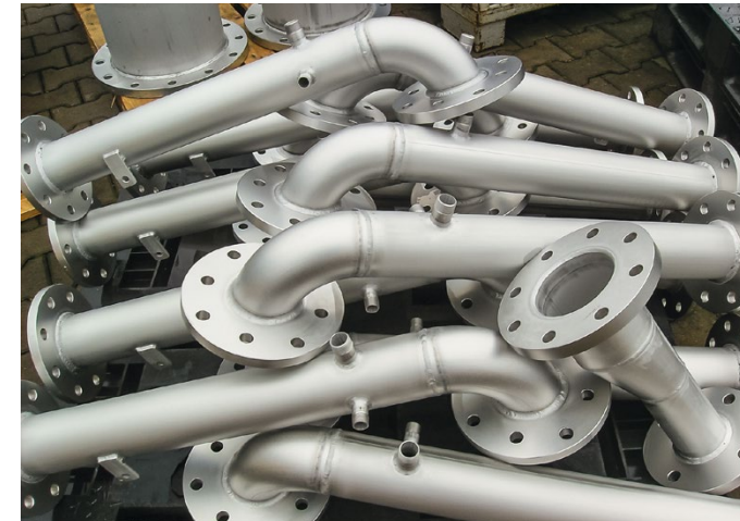
Formstückfertigung DN 100 bis DN 1000 Edelstahl