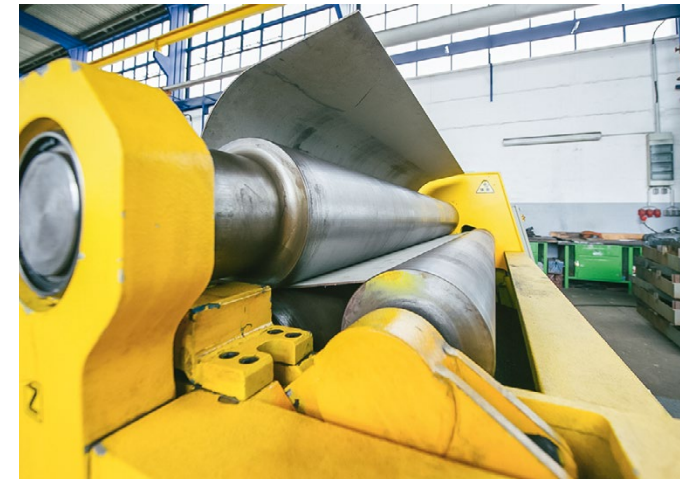
Walzenbiegemaschine für die Herstellung von Sonderanfertigungen - Rohre und Rinnen in U-Form