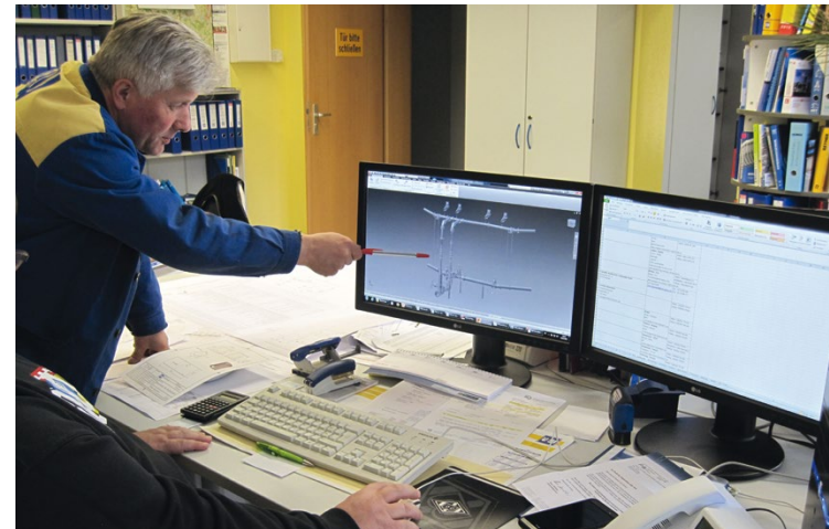
Planung bis zur Montage