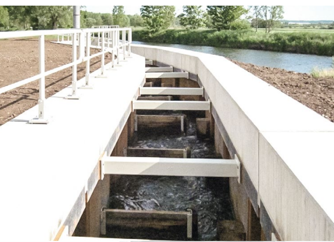
Stahlbauarbeiten für den Beckenpass einer Fischaufstiegsanlage